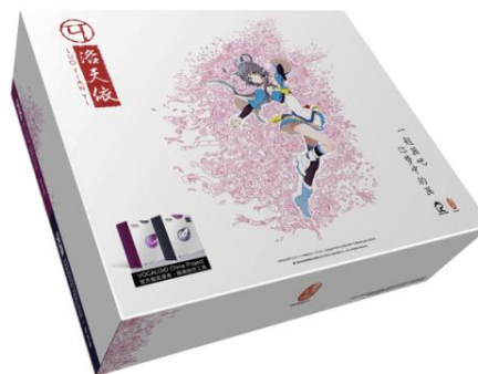
ボカロ作家向けマンガ・イラスト制作スペシャルパッケージ