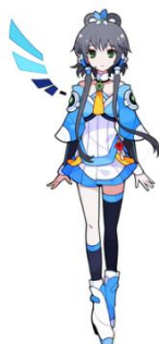
中国における新しい VOCALOID™キャラクター