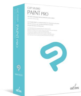
CLIP STUDIO PAINT PRO パッケージ版