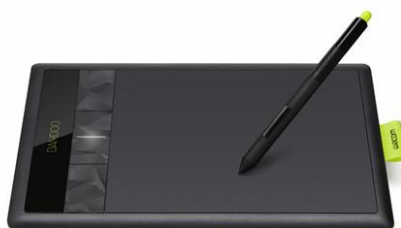
Bamboo Pen&Touch (CTH-470/K1)