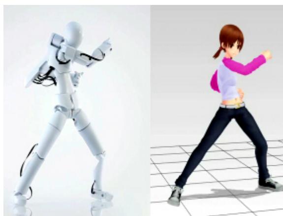
『QUMA』技術による人型 3D 入力デバイス”(左)(下)

技術詳細およびコンセプト動画につきましては、ソフトイーサの技術サイト( http://quma.jp/ )も併せてご覧ください。